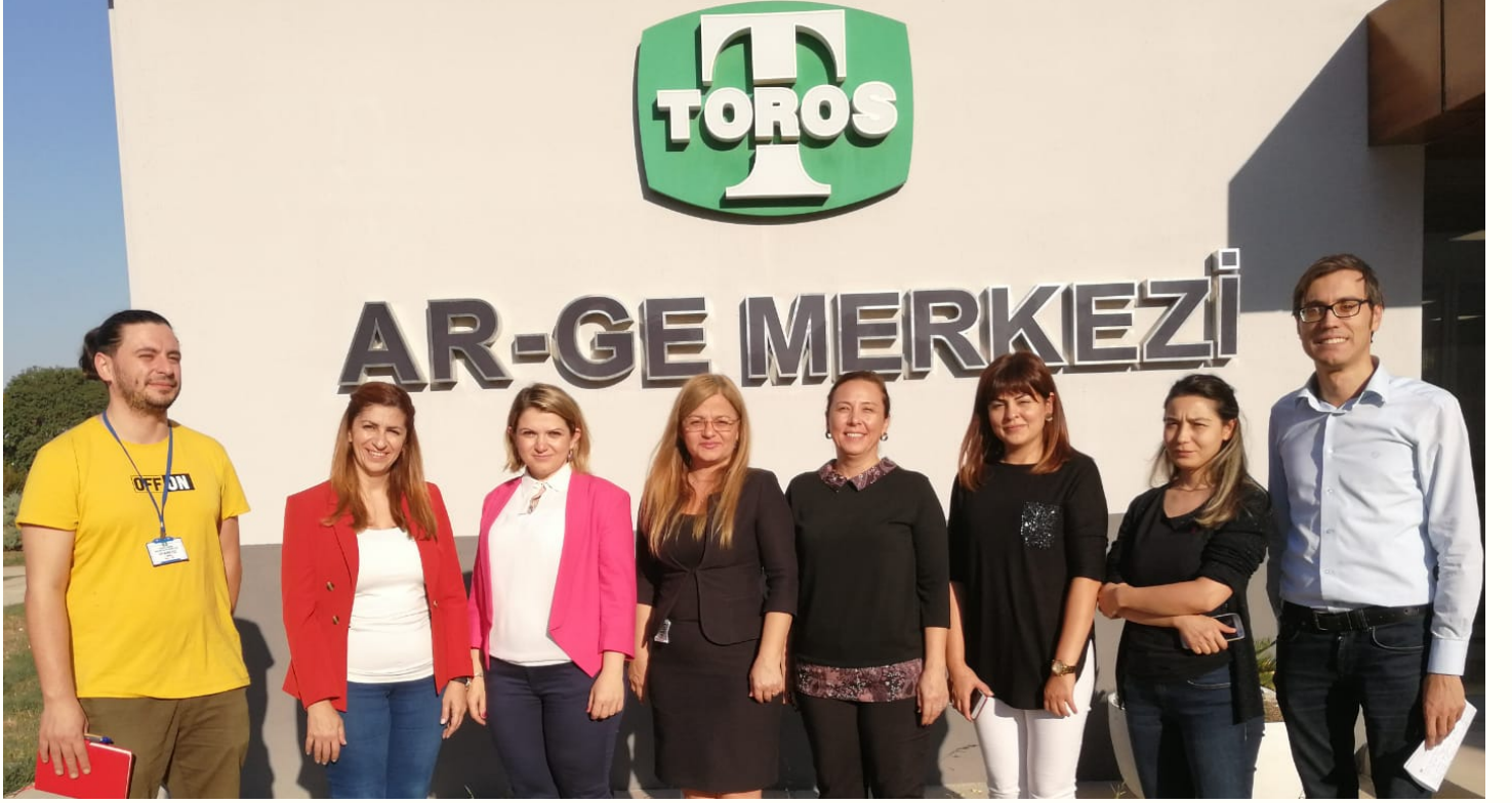
Toros Tarım ve Mersin Teknopark (Technoscope) ile birlikte INOSUIT Tanışma Toplantısı (Mersin İşletme Tesisi), 06 Kasım 2019