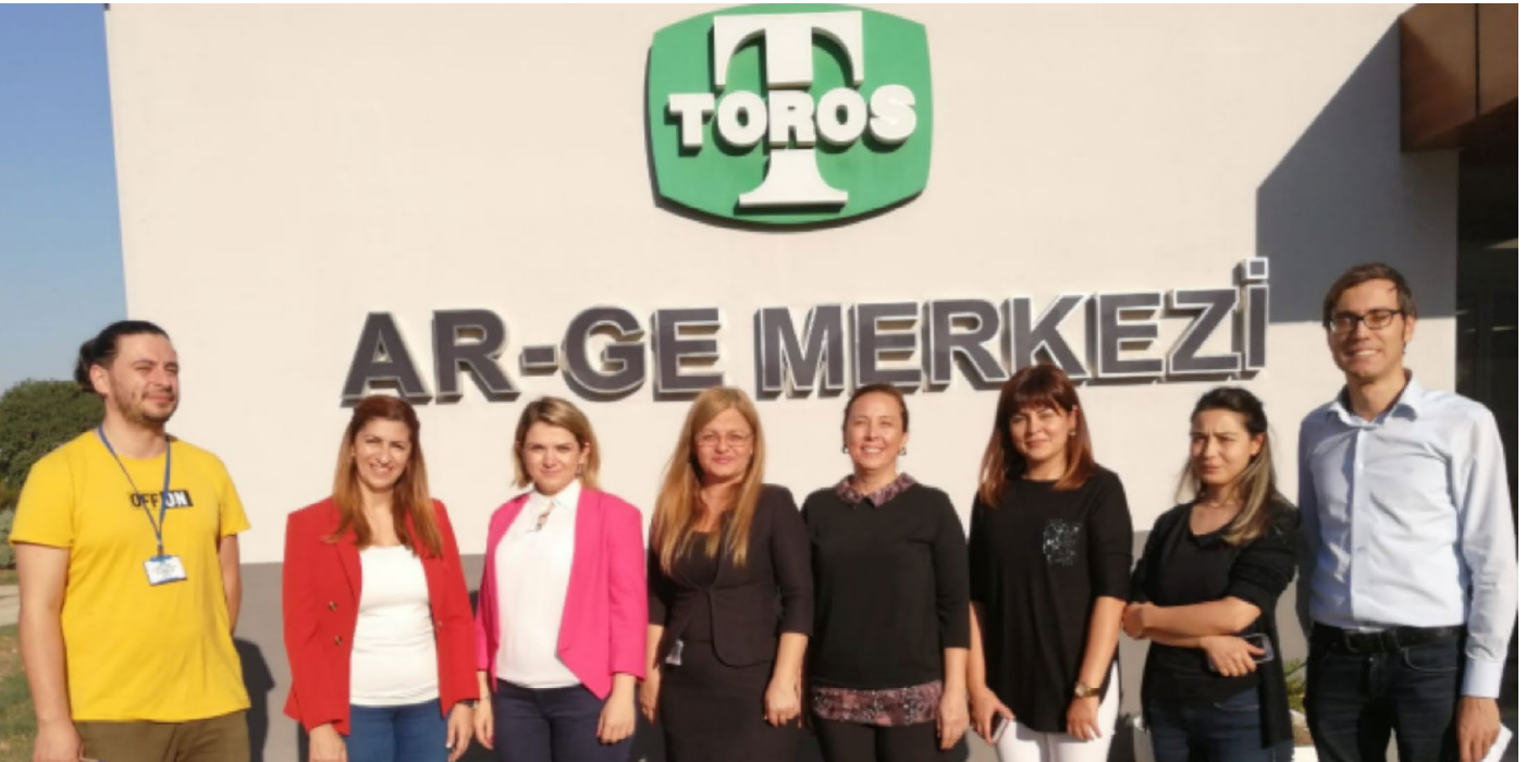
Toros Tarım ve Mersin Teknopark (Technoscope) ile birlikte İNOSUIT Tanışma Toplantısı (Mersin İşletme Tesisi, AR-GE Merkezi, 06 Kasım 2019)

Türkiye İhracatçılar Meclisi (TİM) tarafından 25-26 Aralık tarihlerinde online olarak düzenlenen 8.Türkiye İnovasyon Haftası'na online katılımlar sağlanmıştır.